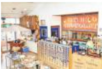
「よく見たら写っている」……勝手にやって無理やり掲載してもらいました。さて何人写っているでしょう？