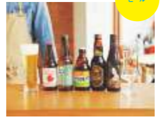
朝から飲む人もいるという、魅惑的なラインアップ。生ビール594円はデンマーク産の(カールスバーグ)。