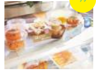
その日によって内容が変わるデリ。756円~のランチボックスやオードブル(3日前までに予約)もあり。