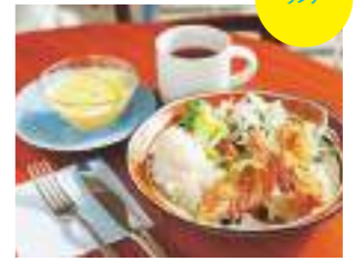
プレートランチ1,080円のメイン料理は週替わり。キャッシュランチは972円。各+162円でスープ付き。