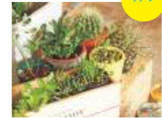
店内を彩るグリーンは一部購入も可。センペルビウムアラクノ...という呪文のような名前の珍しい種類も。