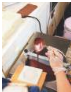
出来たてのチョコレートをひとつひとつ丁寧に型に流します。「オシクナアレ」という呪文を唱えています。