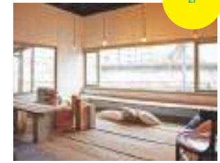
尾道駅を見下ろす窓はまるで展望台。コーヒーと雑誌を傍らに、何時間でもくつろいでいられる。