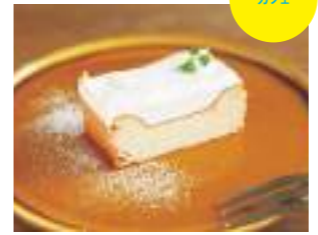
カフェタイムには、黒糖のチーズケーキなど自家製デザート432円~を。スコーンセットはお手頃な216円。