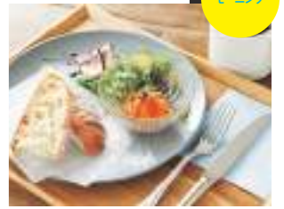
オープンサンド・モーニング864円。好きなデリ2品を選べる。日曜日は2組限定メニューも(要予約)。