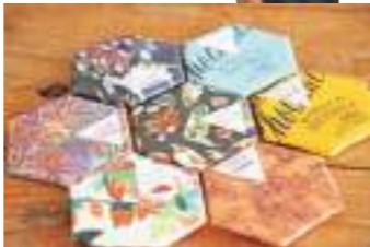
メンバーお気に入りの作家陣によるオリジナルパッケージ。この六角形を見かけたら迷わずゲットだぜ。