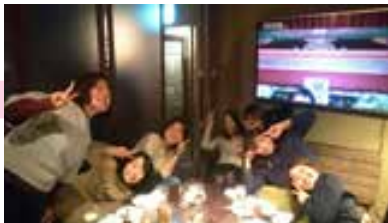
▲波航準備もそこそこに飲み歩く!