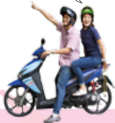
▲会社の人とアパートを二軒ほど下見