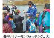
豊平川サーモンウォッチング。大人から子供まで夢中!

北海道の秋の味覚を代表するサケ。遠くアラスカまで旅をして、豊平川に毎年1000～2000匹が遡上します。